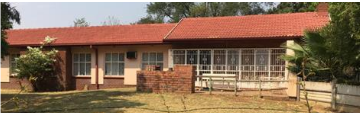
Die pastorie wat verhuur word